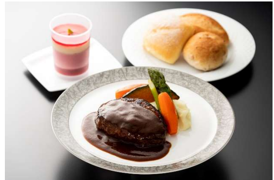
ビジネスクラス機内食