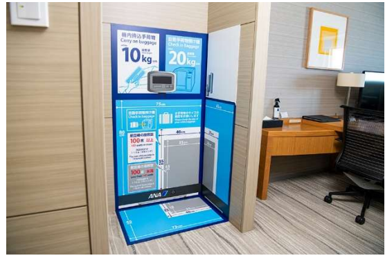
機内持ち込み荷物案内