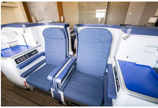
ANA国際線ビジネスクラス(ANA BUSINESS STAGGERED) モックアップシート