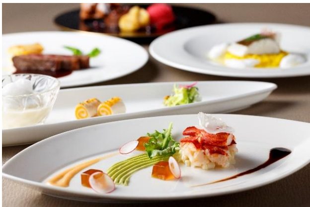
フルコースディナー(イメージ)

(※)オンラインミーティングツールや動画などを使用し、録画とライブを組み合わせで実施されます。