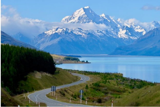
プカキ湖からマウント・クックを望む