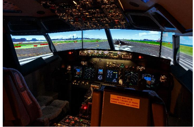
ホテル内フライトシミュレーター(羽田空港 C 滑走路)