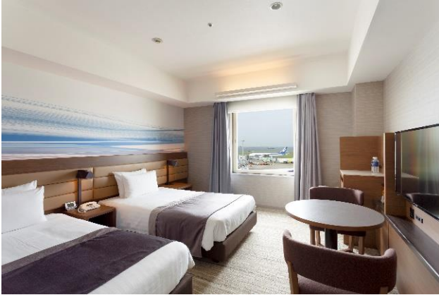
滑走路側客室一例(デラックスツイン)