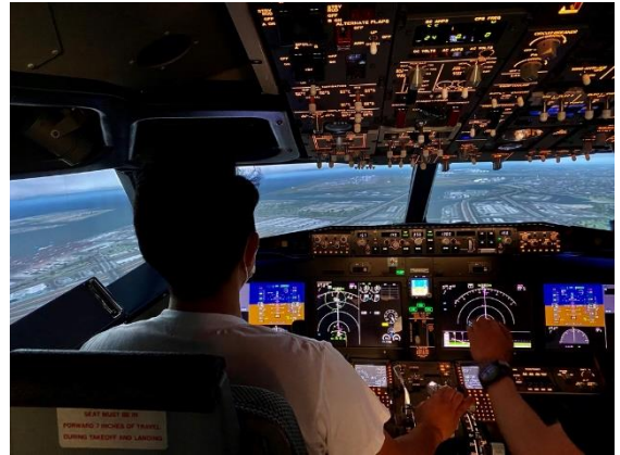
フライトシミュレーター操縦体験イメージ