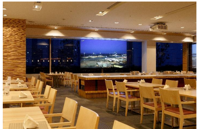
レストラン「フライヤーズテーブル」