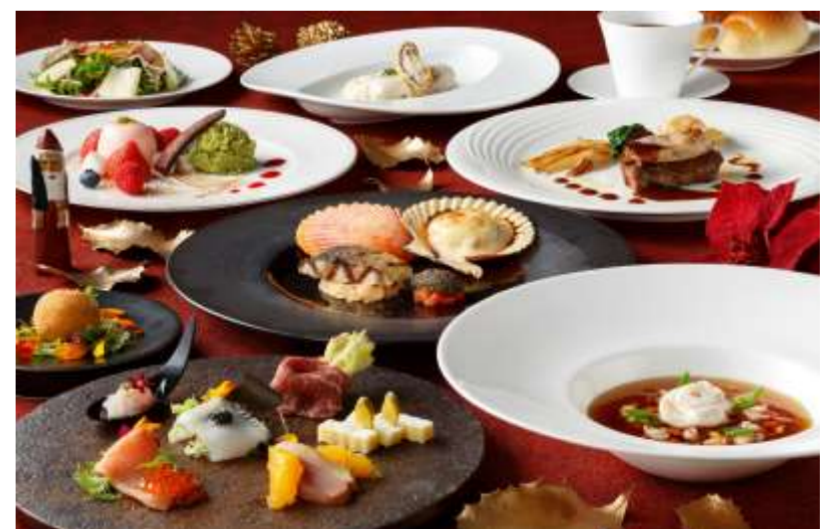
クリスマスディナー