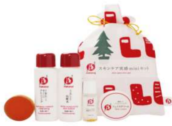
まかないこすめ実感miniスキンケアセット