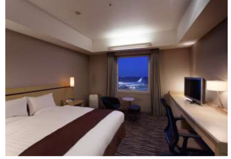
プレミアムダブル(滑走路側)