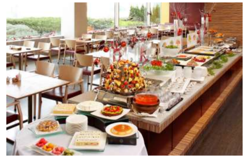
クリスマスランチbuffet