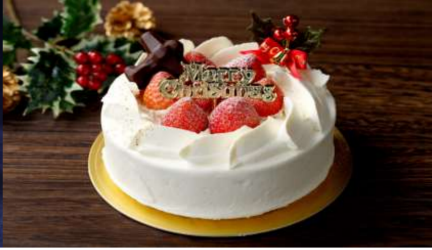
クリスマスケーキ