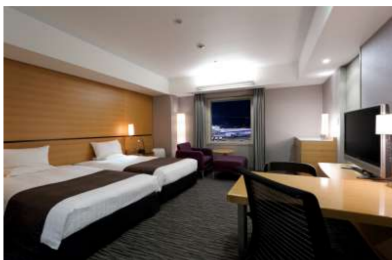
エクゼクティブツイン