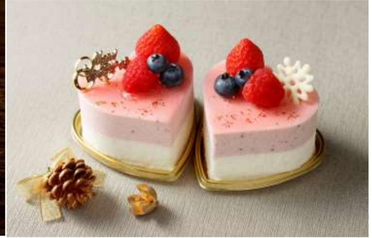
ムース・オ・フリーズ