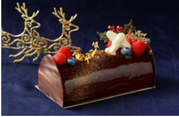
ノエル・オ・ショコラ