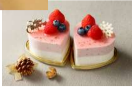
スパークリングワイン&ムース・オ・フレーズ