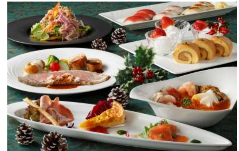
クリスマスファミリーディナー